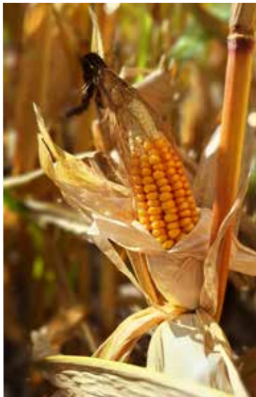
Ramona Schult • Der letzte Mais