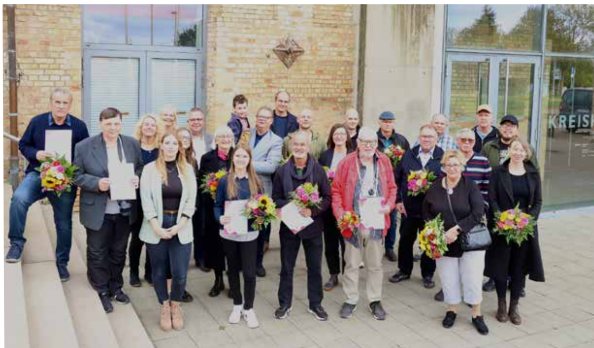
Der Landkreis gratuliert allen Preisträgerinnen und Preisträgern herzlich zu den Auszeichnungen und qualitativ tollen Fotografien!

und Kreativität in einem größeren Raum zu präsentieren. Wir bieten die Möglichkeit, sich über Fotografie und Motive - ganz speziell in Nordwestmecklenburg, auszutauschen und über die Ausstellung der Fotografien ins Gespräch zu kommen“, fasst Anja Eckhardt, Kulturmanagerin im Landkreis, die Idee des jährlich durchgeführten Wettbewerbs zusammen.