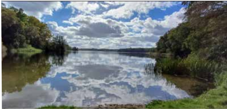
Petra Zündorf • Herbststimmung am Schaalsee in Dutzow

Mit dem Einsenden von Fotos bestätigen Sie, dass Sie der Urheber des eingesandten Materials sind, keine Persönlichkeitsrechte Dritter verletzt werden und stimmen ausdrücklich einer unentgeltlichen Nutzung für alle Verwendungszwecke durch den Landkreis Nordwestmecklenburg zu.