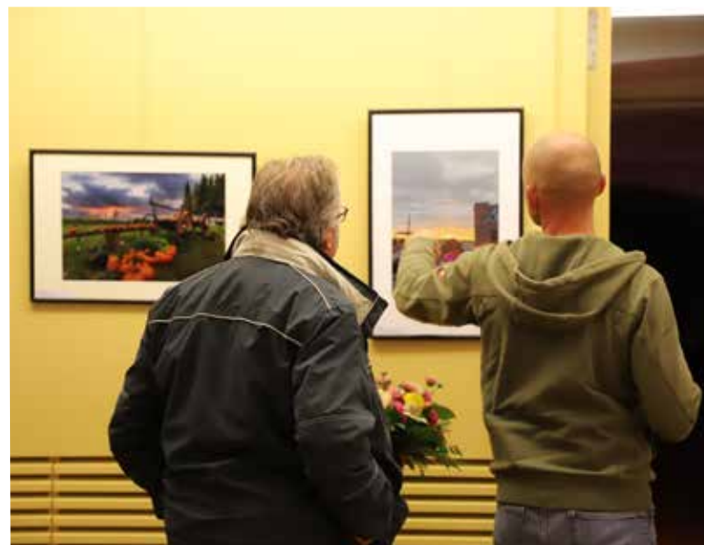
Die anschließende Vernissage bat allen Teilnehmenden und den vielen Gästen die Option für Gespräche und einen Austausch zum Thema Fotografie.

Teilnehmenden sind im Kreistagsaal und im Flur der Malzfabrik ausgestellt und können zu den Öffnungszeiten der Verwaltung und auf Nachfrage besucht werden. Eine Wanderausstellung ist in der Museumsanlage in Gadebusch, in der Stadtbibliothek in Wismar und im Rathaus in Grevesmühlen geplant und wird durch den Fotoclub '82 Grevesmühlen organisiert.