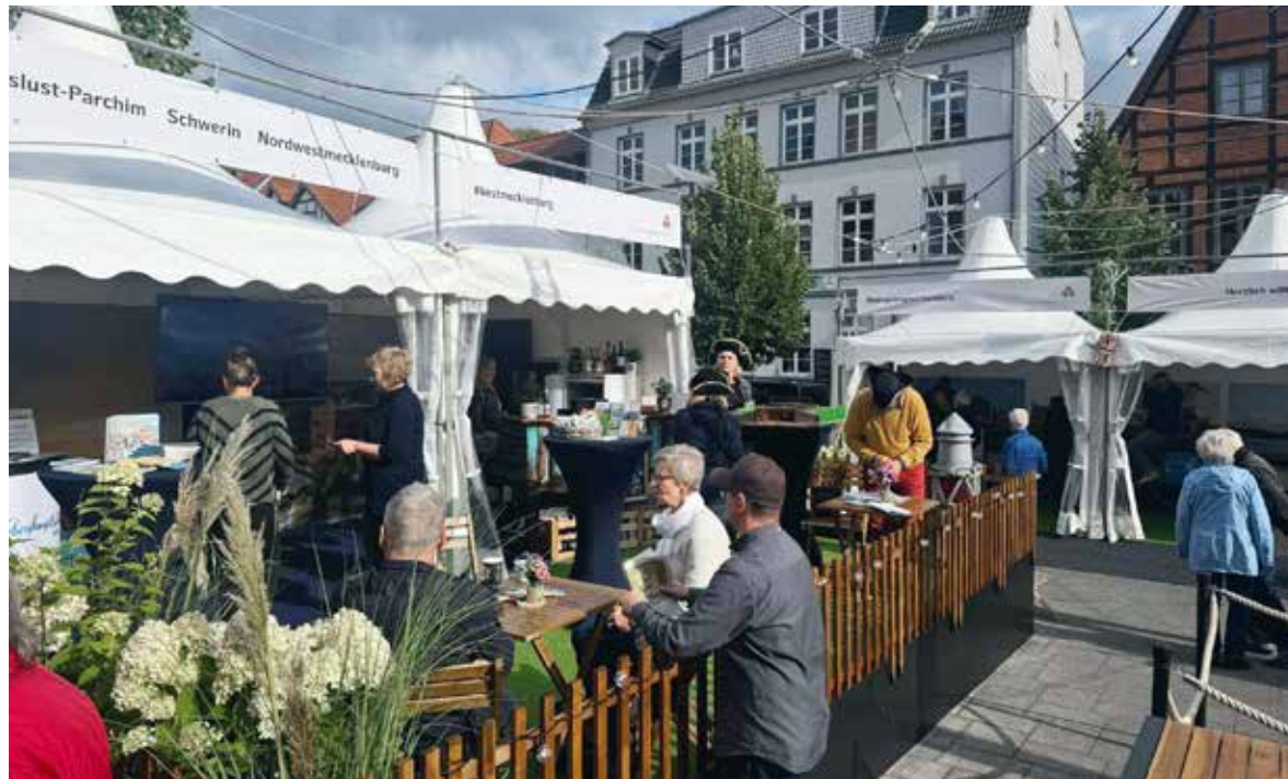
Gemeinsame Feier: 34 Jahre deutsche Einheit und knapp 99.000 Menschen in Schwerin.